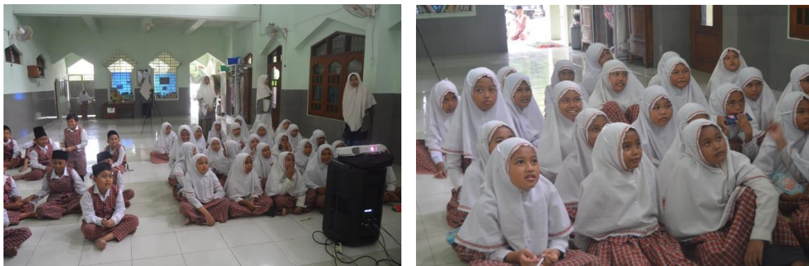
Gambar 2. Kegiatan Penyuluhan kepada Siswa Siswi MI Nurussalam

Selain materi edukasi dari video, siswa juga diberikan pertanyaan kuesioner tentang swamedikasi untuk penyakit influenza. Kuesioner berisi 5 pertanyaan closed-question yang mampu mengukur pengetahuan dasar tentang penyakit influenza. Kuesioner diisi oleh 44 siswa dan didapatkan hasil yang tercantum pada Tabel 1 .